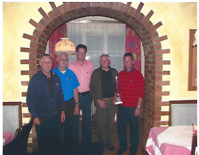
SIGER MEISTERLIGA ATSV BA 1