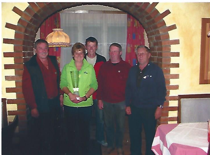
SIGER OBERLIGA BOSNA MIX 1