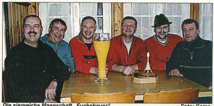
Die siegreiche Mannschaft „Fuchsbauer“.

Anschuß: 9.00 Uhr 4 Kehl Nenngeld Euro 8.-- Preisverteilung Schneiderwirt Beste Erstmals Wanderpreis I Schnaps für alle übrigen Sauk Danke für Wanderpreis und Pokal