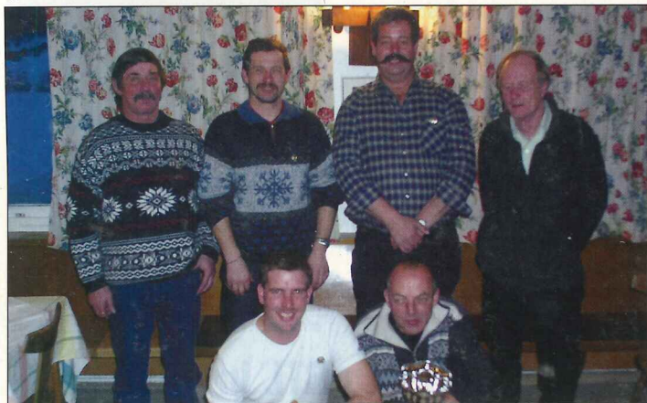
Die erfolgreiche Mannschaft „Grundsee III“.