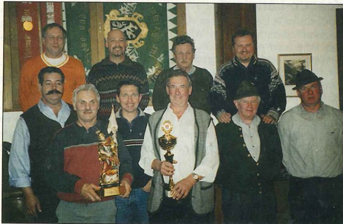
Der Sieg ging an „FF Strassen I“.