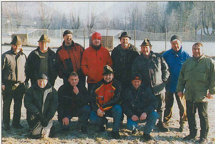
Die siegreichen „Fuchsbauerschützen“.