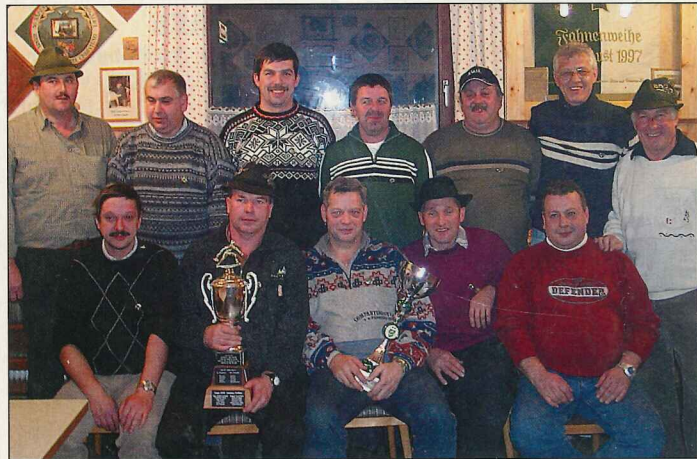
Die siegreiche Moarschaft „Rigips II“.