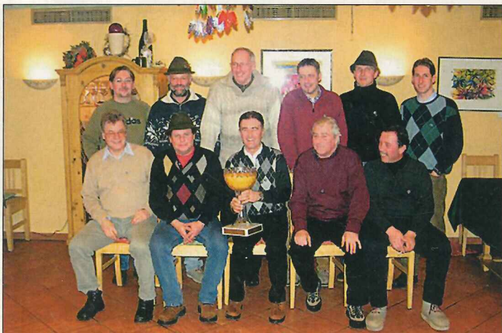
Die siegreichen Schützen.