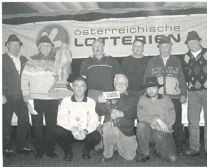
Die Siegermannschaft des 3. Salzkristallturniers