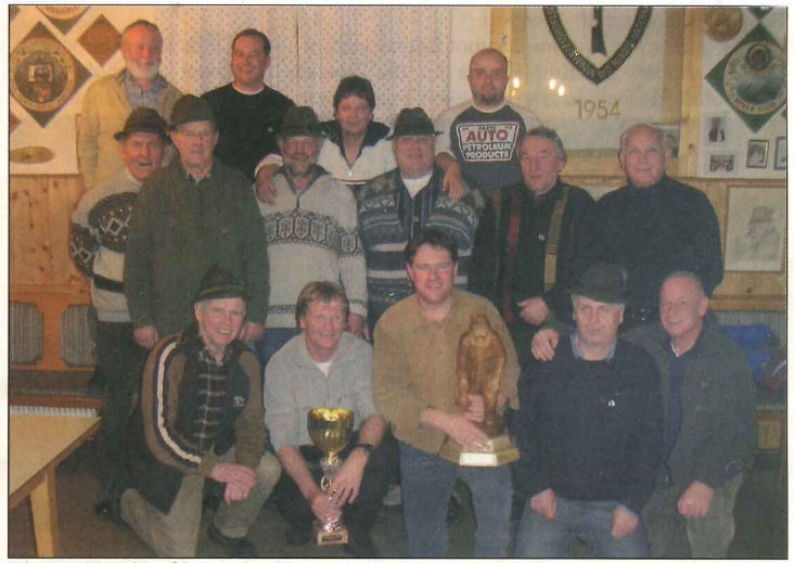
Die strahlenden Sieger der Moarschaft „Unterkainisch“.