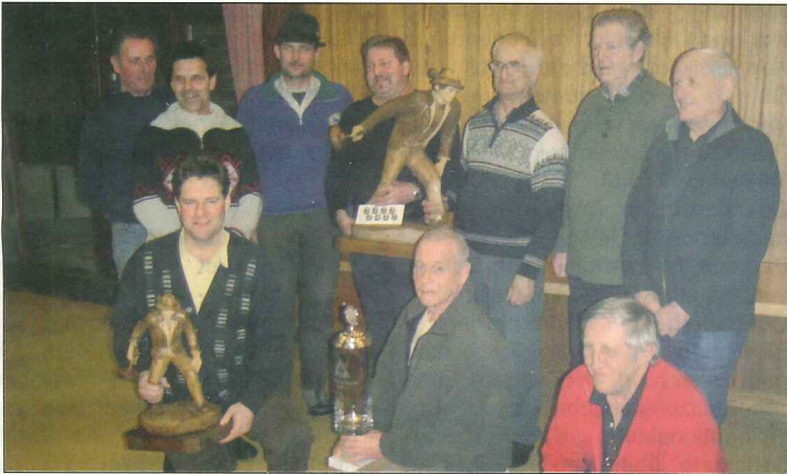
Die siegreiche Mannschaft ATSV Bad Aussee I