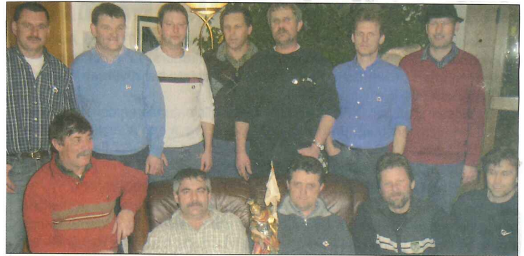
Die Pass „FF Grundlsee 2“ gewann das Eisschießen.